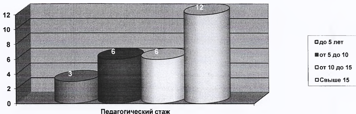
Диаграмма распределения педагогов по стажу работы

Анализ по педагогическому стажу: до 5 лет – 3 человек, от 5 до 10 лет – 6 человек, от 10 до 15 лет – 6, свыше 15 лет – 12 человек