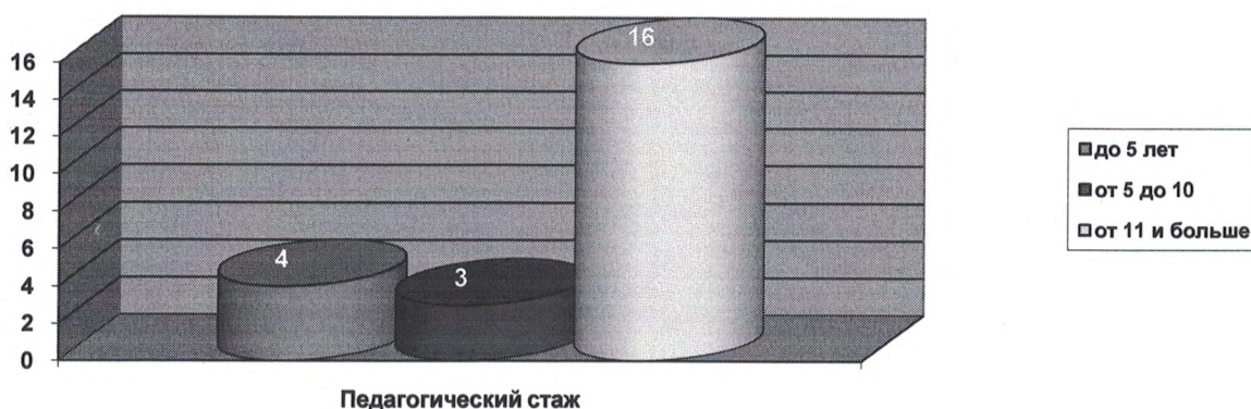
Диаграмма распределения педагогов по стажу работы

Вывод: в Детском саду созданы кадровые условия, обеспечивающие качественную реализацию образовательной программы в соответствии с требованиями обновления дошкольного образования. В учреждении созданы условия для непрерывного профессионального развития педагогических работников через систему методических мероприятий в Детском саду. Педагоги МБДОУ № 52 зарекомендовали себя как инициативный, творческий коллектив, умеющий найти индивидуальный подход к каждому ребенку, помочь раскрыть и развить его способности. Таким образом, система психолого-педагогического сопровождения педагогов, уровень профессиональной подготовленности и мастерства, их творческий потенциал, стремление к повышению своего теоретического уровня позволяют педагогам создать комфортные условия в группах, грамотно и успешно строить педагогический процесс с учетом требований ФГОС и ФОП ДО. Однако необходимо педагогам и узким специалистам более активно принимать участие в методических мероприятиях разного уровня, так как это, во-первых, учитывается при прохождении процедуры экспертизы во время аттестации педагогического работника, а во-вторых, играет большую роль в повышении рейтинга Детского сада.